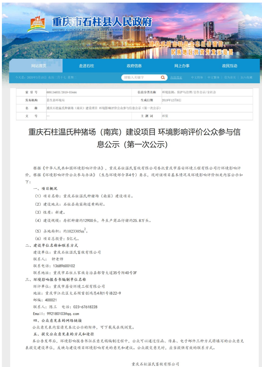
图 2.2.1-1 第一次网络公示截图