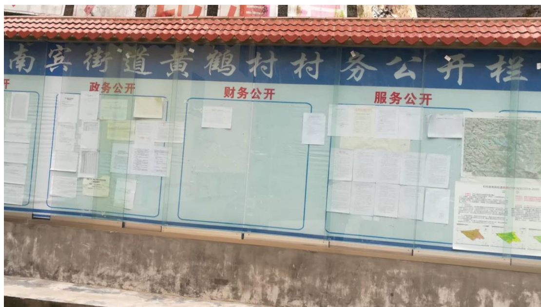
图 3.2-4 第二次公示现场张贴公示