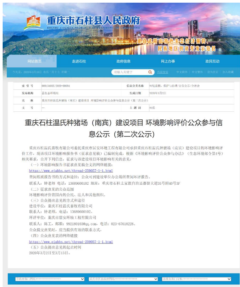
图 3.2-1 第二次网络公示截图