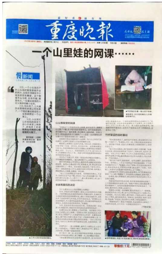
图 3.2-3 第二次公示第二次登报公示（2020 年 3 月 6 日）